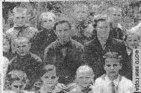
Азовской сельской администрации